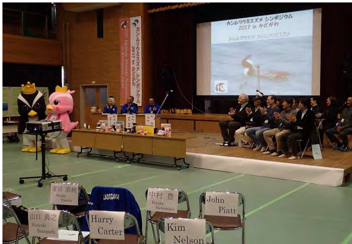
Figure 4. Opening event of the symposium on 18 March. Even if Harry was not at the venue, no one took his chair away.

シンポジウムは成功裡に終わりました(図4)。町長と教育長は本当にこの結果に満足されていました。Harryは調査手法の標準化までは至らなかったものの、専門者会議の参加者全員が、カムリウミスズメの研究者全員が使用できる共通の調査プロトコルの確立が必要である、という同意に至った点を、大きな前進だと嬉しそうに聞いてくれました。