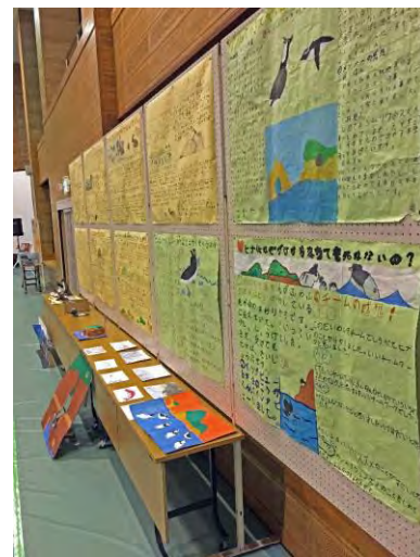
Figure 2. Murals, depicting the life of the Japanese Murrelet, painted by elementary school students, cover the sea wall in Kadogawa.